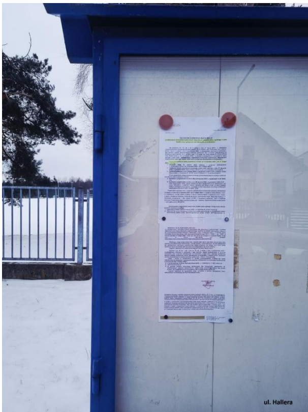
Fot. 6. Ogłoszenie na tablicy ogłoszeń przy ul. Hallera.