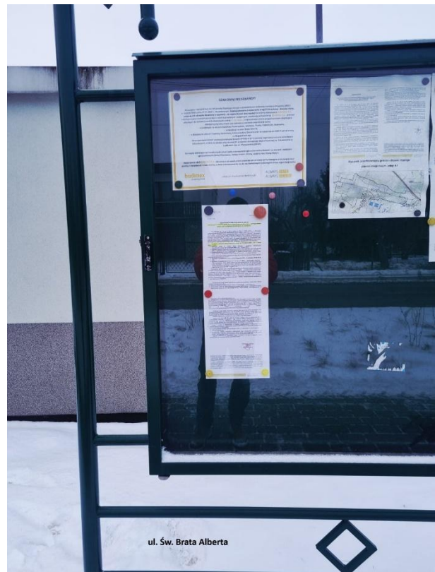
Fot. 7. Ogłoszenie na tablicy ogłoszeń przy ul. Św. Brata Alberta.