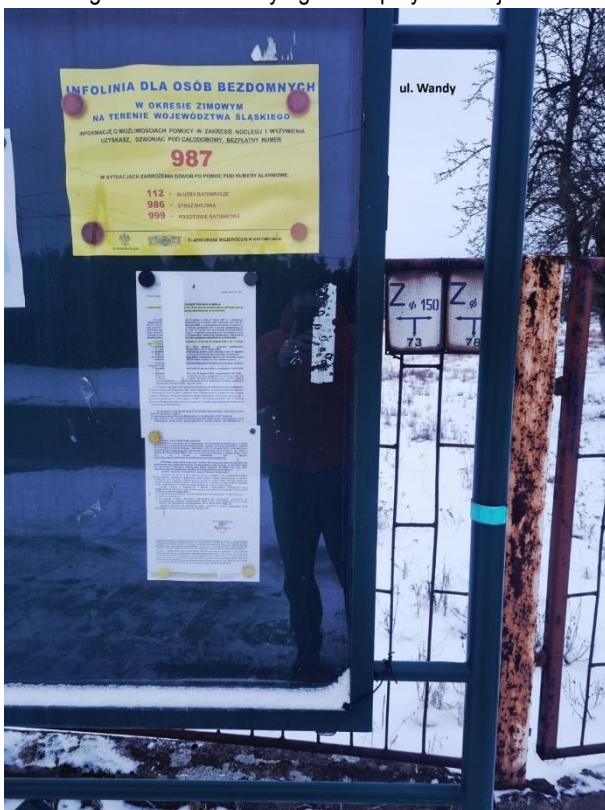
Fot. 4. Ogłoszenie na tablicy ogłoszeń przy ul. Wandy.