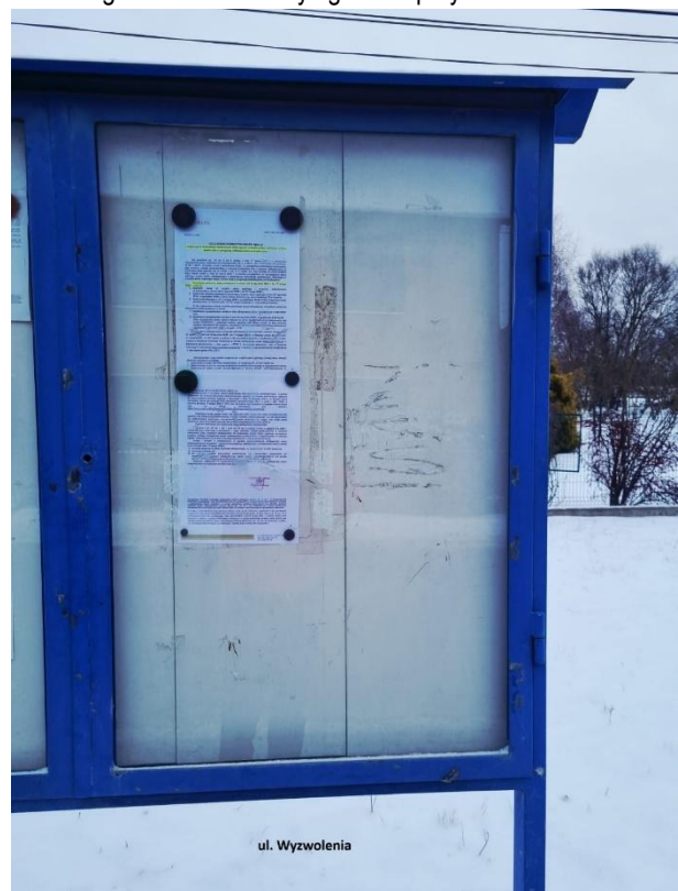
Fot. 9. Ogłoszenie na tablicy ogłoszeń przy ul. Wyzwolenia.