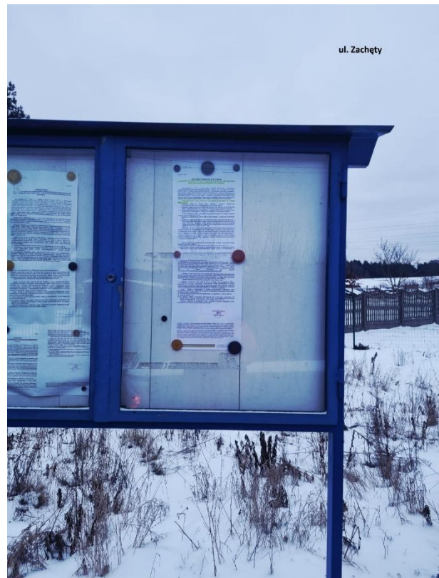
Fot. 3. Ogłoszenie na tablicy ogłoszeń przy ul. Zachęty.