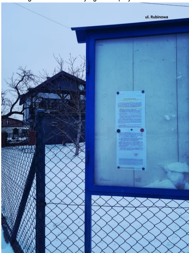
Fot. 8. Ogłoszenie na tablicy ogłoszeń przy ul. Rubinowej.