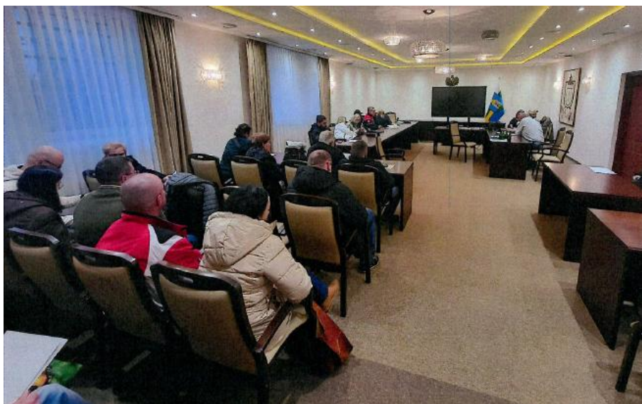
Fot. 11. Punkt konsultacyjny.

W celu zapewnienia udziału możliwie szerokiego grona interesariuszy konsultacje społeczne zostały przeprowadzone dodatkowo w formie: