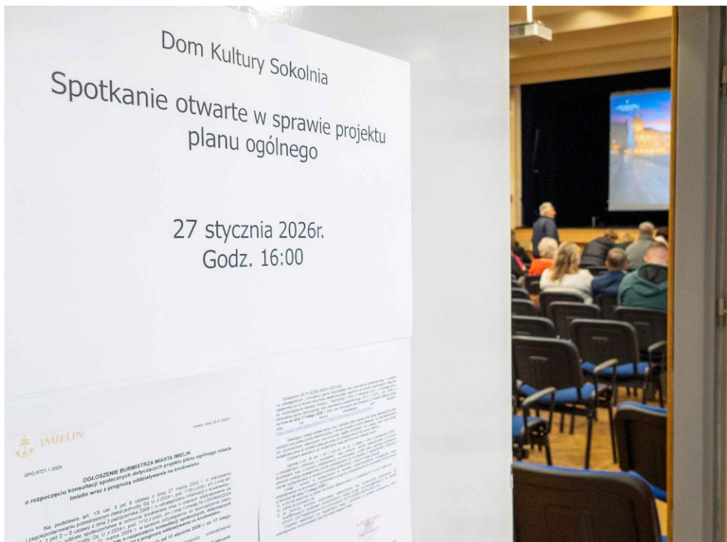
Fot. 10. Spotkanie otwarte.